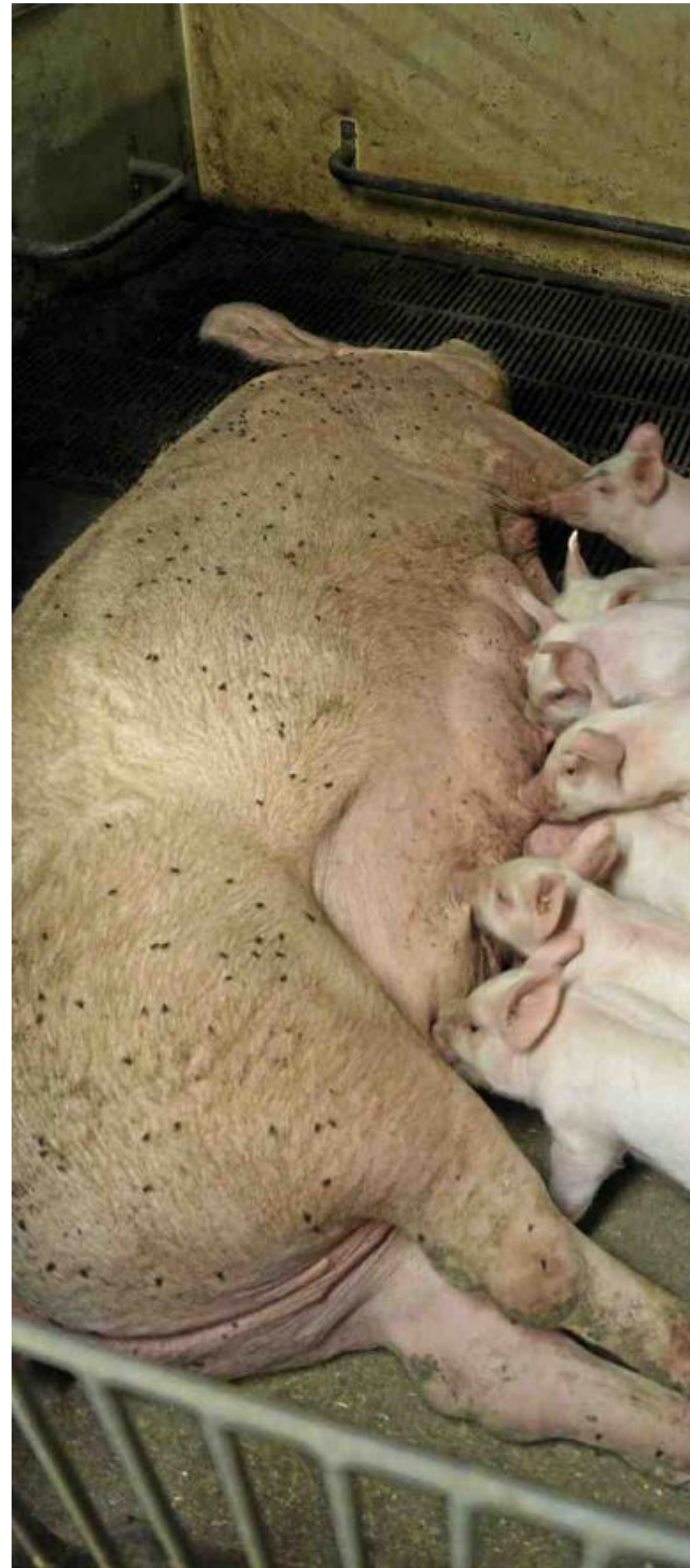
HAR KNORREN KVAR. Danska smågrisar med knorren kvar på ras i fyra dagar i samband med grisningen.